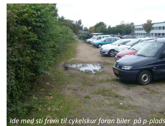
Ide med sti frem til cykelskur foran biler på p-plads

Uofficiel afsætning til SFO ved Parcelvej.