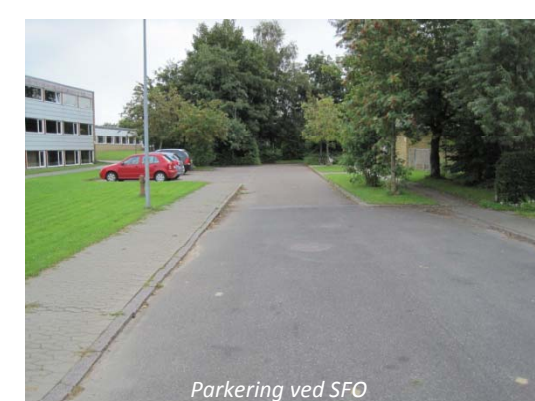
Parkering ved SFO