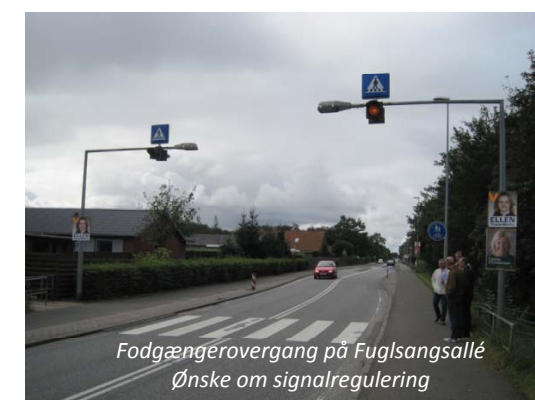
Fodgængerovergang på Fuglsangsallé Ønske om signalregulering