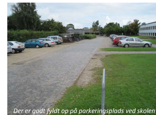
Der er godt fyldt op på parkeringsplads ved skolen