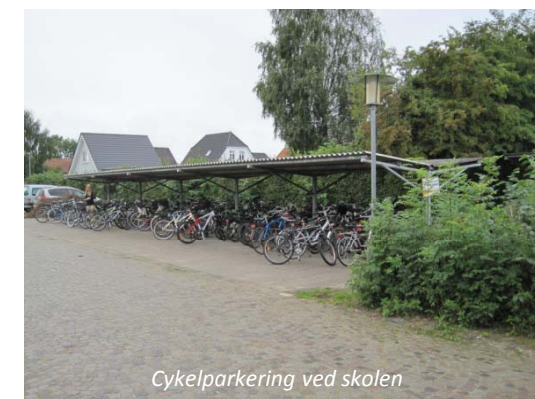
Cykelparkering ved skolen